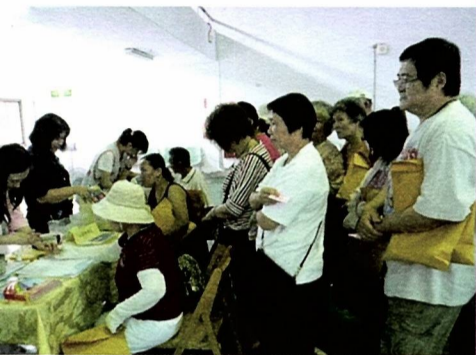
圖2 免費血壓血糖檢測服務