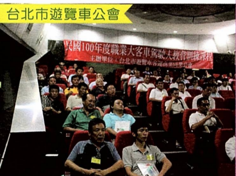
圖4 本會與台北市衛生局主辦之「預防中風」講座