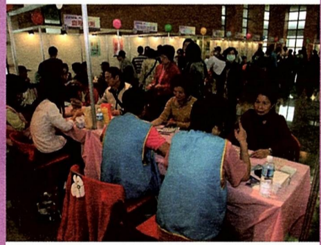
圖10 服務多元民眾踴躍參與