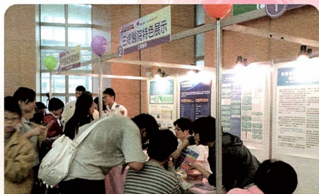
參與台灣腦中風病友協會在板橋市政府舉辦之活動