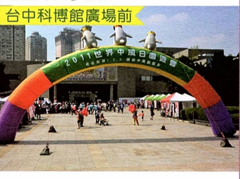
圖5 世界中風日園遊會