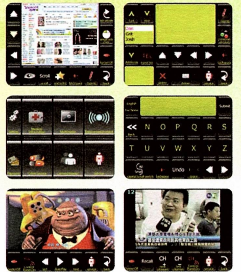
溝通表達 多媒體娛樂 網路運用

阿春眼動看護採用先進的瞳孔移動辨識技術，使用者只需觀看螢幕，系統即可判別所注視的位置，透過凝視或眨眼就可操作電腦。