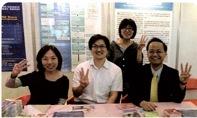
參與台灣腦中風病友協會在板橋市政府舉辦之活動