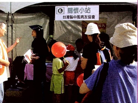
圖6 本會設立的關懷小站現況