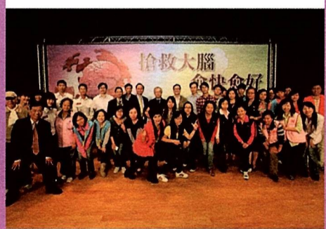
圖11 會後工作人員合影