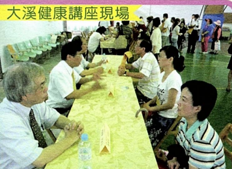
大溪健康講座現場