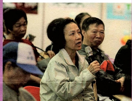
圖9 現場民眾踴躍發問