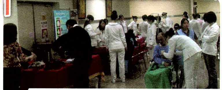
成立台灣腦中風病友協會三總分會病友會場景