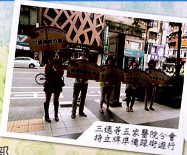
三總等五家醫院分會 特立牌準備踩街遊行