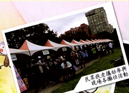
民眾扶老攜幼參與 現場各攤位活動