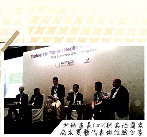
尹秘書長(右3)與其他國家病友團體代表做經驗分享