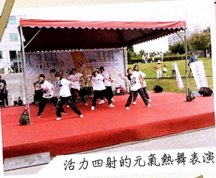
活力四射的元氣熱舞表演