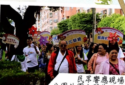
民眾響應現場 公園外圍之踩街遊行