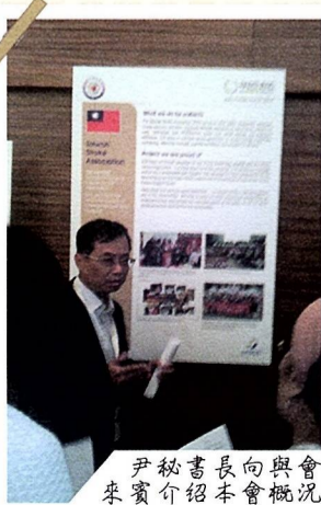
尹秘書長向與會來賓介紹本會概況

本屆論壇，提供了一個國際病友團體的交流平台與跨領域經驗分享，涵蓋主題從提升患者的心理福祉與照護者的權力，到如何募資來持續性經營、擴展並增加會員的參與度、和增進社群媒體參與的營銷策略。儘管與會團體看似有著完全不同的目標和多元化的性質，本會卻提供了一個全方位的角度，促進彼此間學習和交流，將會鼓勵病友團體間激發出有效管理與的新創意視角。正如本次會議所強調的主題，這是一個創造「以病人為中心的服務計劃」很好的開始。