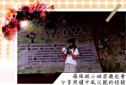
羅佩琪小姐受邀赴會 分享照護中風父親的經驗