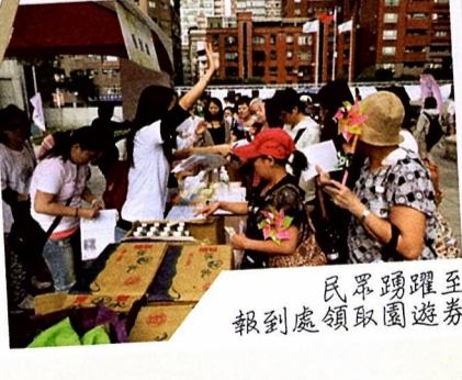
民眾踴躍至 報到處領取園遊券