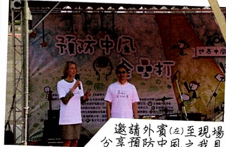
邀請外賓(左)至現場 分享預防中風之我見