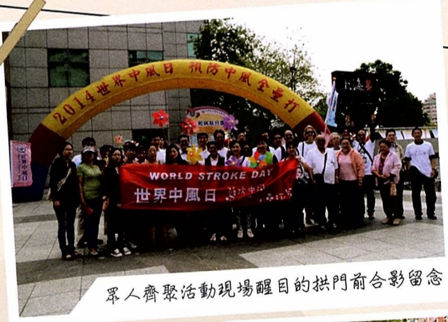
眾人齊聚活動現場醒目的拱門前合影留念