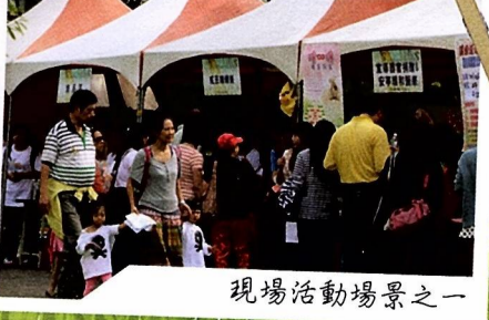
現場活動場景之一