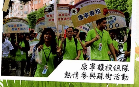
康寧護校組隊 熱情參與踩街活動