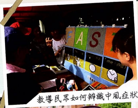
教導民眾如何辨識中風症狀